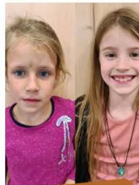
Lina, Luisa, Lotta (ohne Bild)