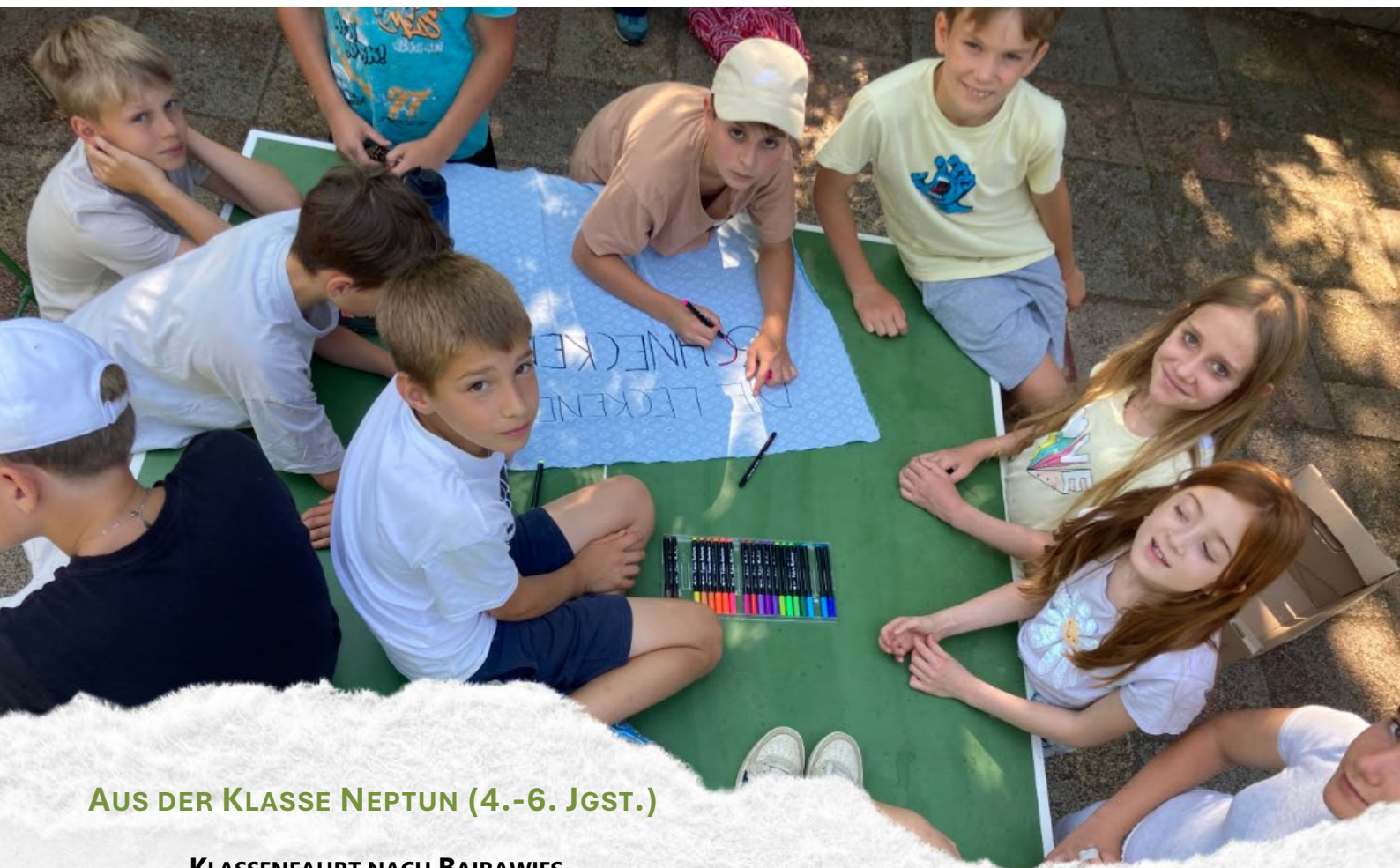
AUS DER KLASSE NEPTUN (4.-6. JGST.)